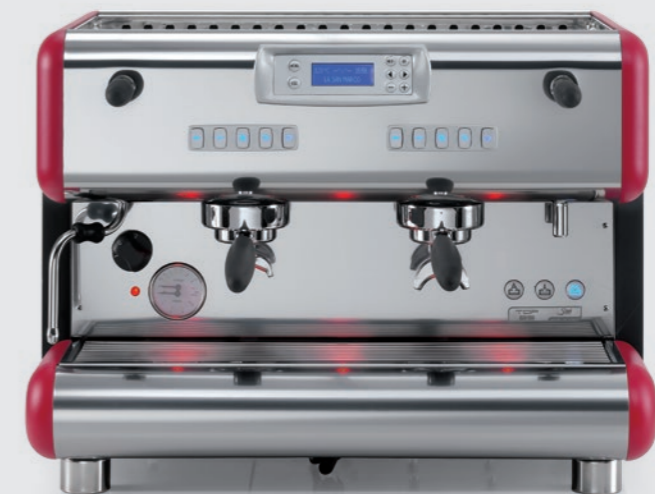
TOP 85 SPRINT