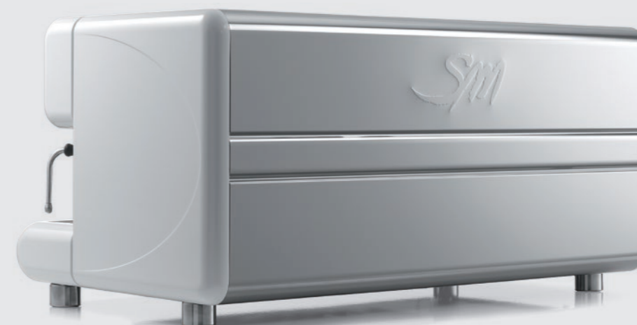
TOP 85 3gr.