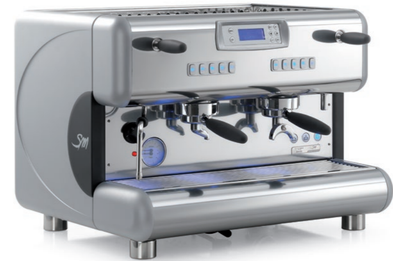
TOP 85 SPRINT

Another new feature is the use of a filter cup holder and steam/water levers with a new handle with an extremely modern, ultra-ergonomic design. TOP 85 is offered in the standard version with a flow variator or in the version with the DTC system, which provides an additional heat exchanger in the brewing unit.