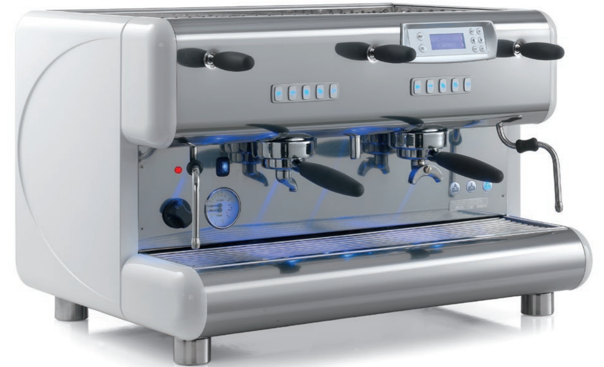
TOP 85 2gr.

TOP 85 represents the technical evolution of the historical and famous Series 85, which is appreciated in Italy and all over the world. In addition to its renown characteristics of robustness and reliability, La San Marco has now added a modern display, an illuminated working surface with multicoloured LEDS and automatic electronic control of the boiler temperature. The new glossy white and satin white colours, together with anti-fingerprint stainless steel, enhance the new look of the TOP 85.