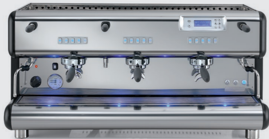
TOP 85 3gr.