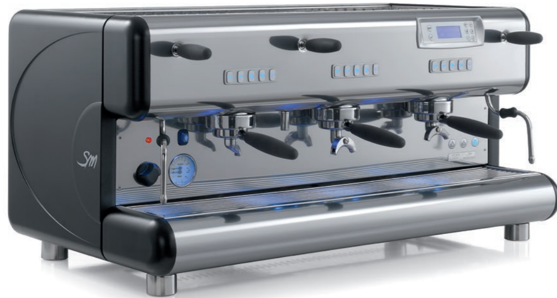
TOP 85 3gr.

TOP 85 uses an ergonomic and functional back-lit keyboard for every group. All keyboards are connected electronically to a graphical display, which integrates the programming performed using the keyboards. This makes additional settings and controls possible and provides a series of information that is very useful for the user.