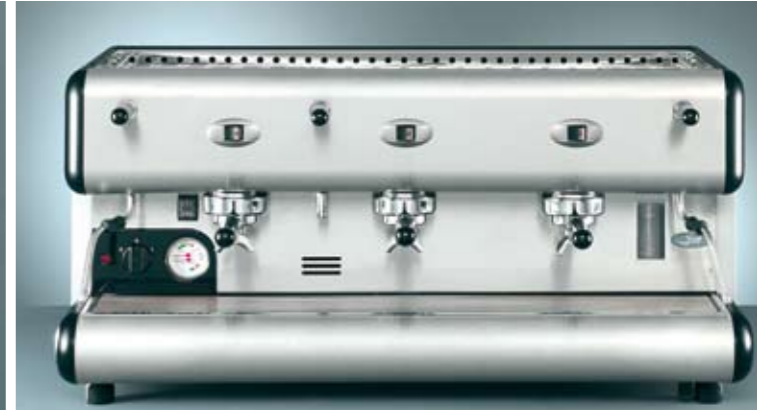
85 S 3 GR.