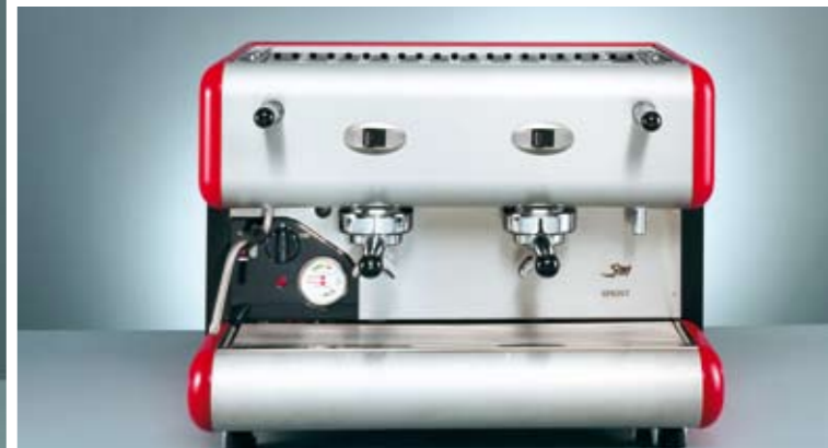
85 Sprint S