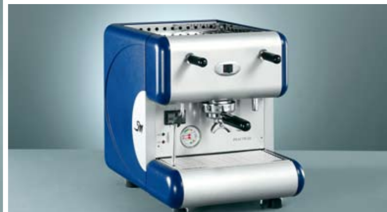
85 Pratical S