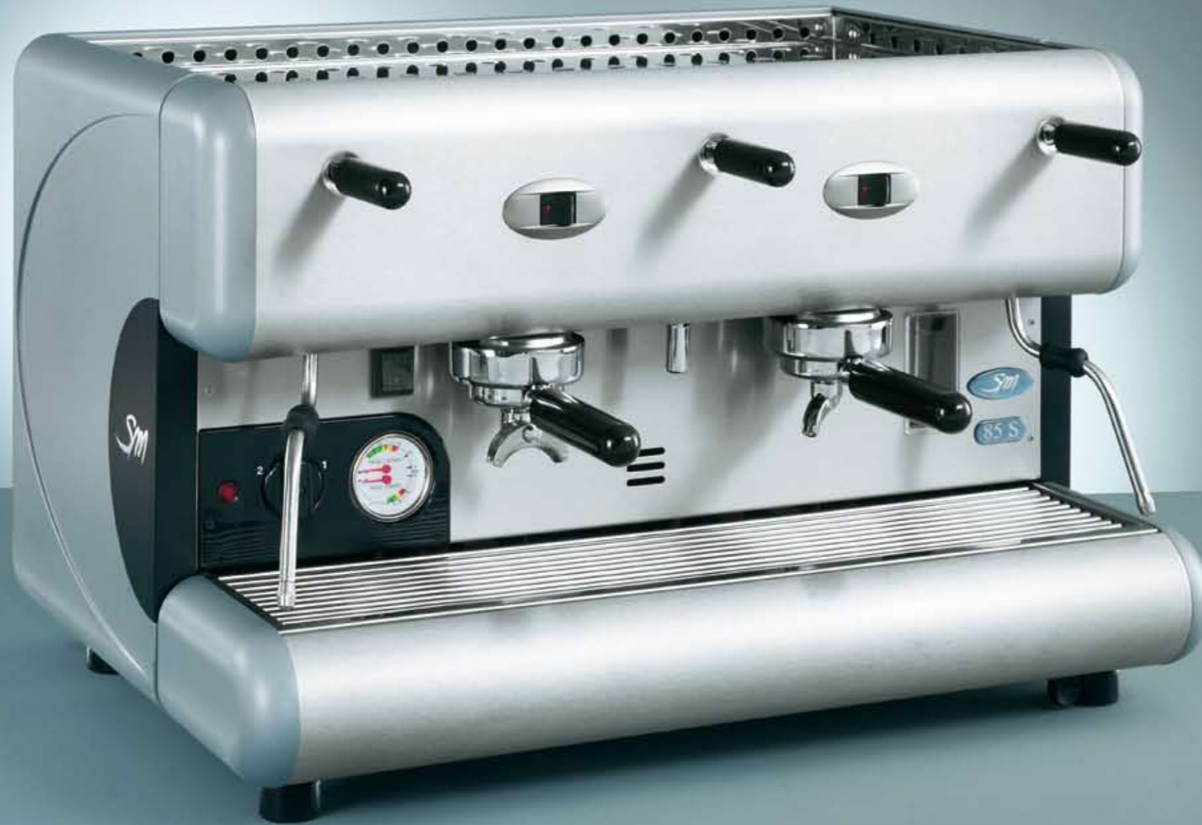
85 S 2 GR.